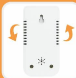
阻燃外壳 对流散热