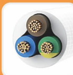
全铜大电流三芯电源线